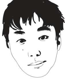
イラスト・柏木翔子

友人の結婚式に行つてまいりました。誓いのキスの時、なぜか斜め右下からえぐるように(まるで海面にダイナミックに浮上する鯨)キスをした友人を見てドキドキしました。